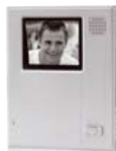
1x Hands free monitor including wall bracket