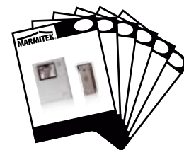
1x User manual English, Deutsch, Français, Español, Italiano, Nederlands.