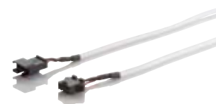
1x 10 meters 4-wire connection cable for doorbell with camera